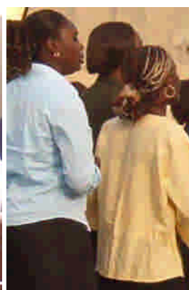
Öronringar i Senegal

Att en församling eller en kör dansar till sångerna är en yttring, som är ovanlig för pastorer från Burundi. I Burundi händer det att en kör i pingstkyrkan idag gör gester med händerna men inte så många fler rörelser. Dans var en sak som man samtalade om. Vid de samtal jag hade med burundierna påpekade jag, att det finns skillnader som man måste acceptera och också lära sig uppskatta om man skall gå in i ett samarbete. Besöker man olika länder upptäcker man olika seder i pingstförsamlingar. Beträffande nattvarvsfirandet ställde jag frågan om man använde en kalk eller flera, när församlingarna firade nattvard i Burundi. Svaret var vi. I de stora församlingarna så använder man av praktiska skäl alltid ett flertal kalkar. Kanske CEPBU bör modifiera sitt beslut inför kommande missionssamarbete?