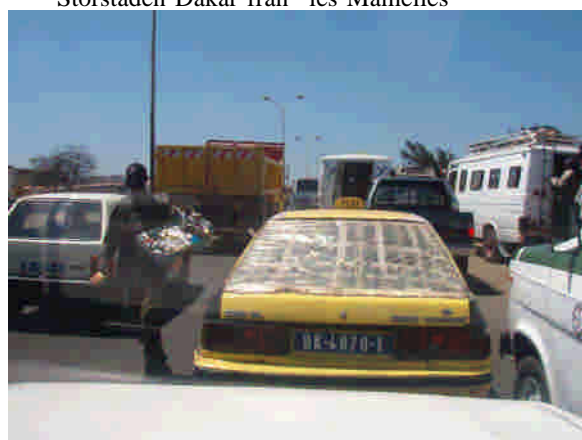
Trafiken på infarten till Dakar.