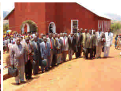
Pastorerer en söndag i Burundi.