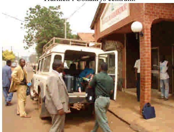
Vårt kvarter i Taoyha, Mariador Park, i Conakry, där vi bodde under vistelsen i Guinea.

Guineas ekonomi närmar sig en katastrof. Veckan innan jag kom med burundierna till Conakry hade det varit generalstrejk. Allt stod stilla under strejkveckan. Vi hade tur som kom veckan efter storstrejken. Orsaken till strejken är inflationen som gör att folk inte längre kan försörja sig på sina löner. Vad som är grunden till problemen finns det olika uppfattningar om. Att det är en ekonomisk kris råder ingen tvekan om. Jag har besökt Conakry nästan varje år