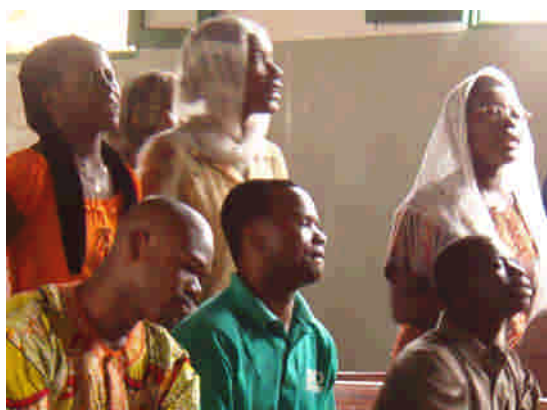
Täckta huvuden i Taoyah