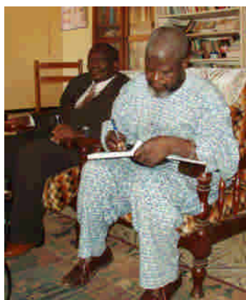
Missionär från Togo i Diourbel

I Diourbel arbetar en missionär från Togo som vi mötte på bibelinstitutet i Dakar, där han också undervisar (bilden nedan till vänster). Vid ett besök i Diourbel besökte vi bostaden och kunde där hälsa på missionärsfrun.