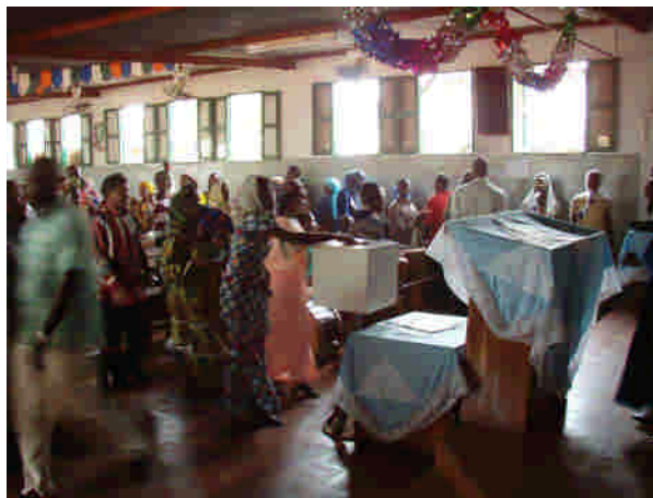
En broder dansar runt i lokalen i Mbour och församlingen dansar fram för att ge sin kollekt i Conakry.