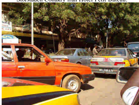
Trafiken i Conakrys centrum.