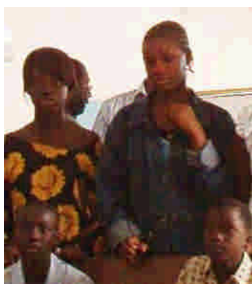
"Nattvarvsfrågan" i Grand Yoff

När det gäller öronringar kan man skämtsamt säga att flickorna i Senegal föds med ringar i öronen och ingen ifrågasätter bruket. I Burundi finns kanske inställningen kvar, att det är ett hedniskt bruk.