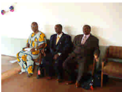
En söndag i Conakry, Guinea.

Pingstpastorerer i Burundi brukar uppträda i kostymer och slips. I Västafrika möter man en mer varierad klädstil under ämbetsutövningen.