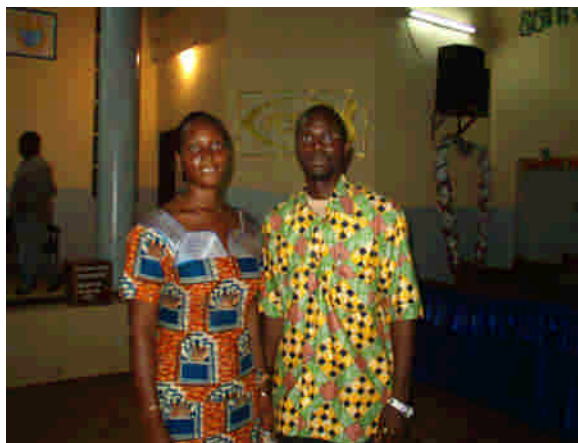
8 mars 2006