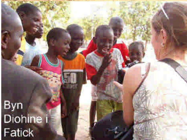
Byn Diahine i Fatick