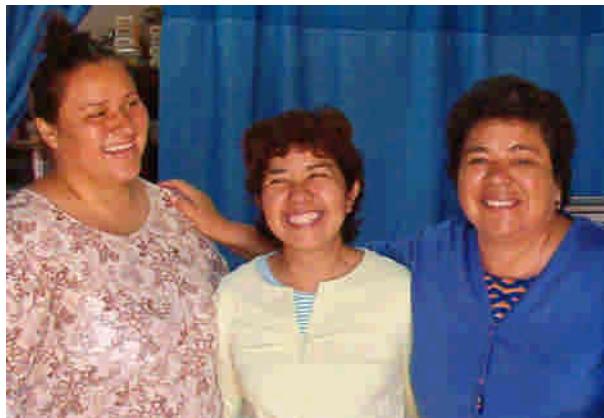
Missionärer från Mexico