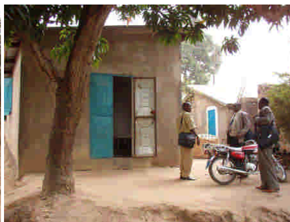
Nuvarande kyrkolokal i Kindia