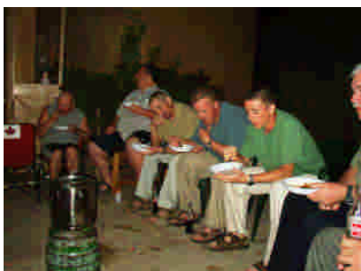
Möte med kanadensiskt kyrkbyggarteam