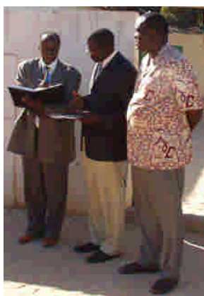
Missionärer från Elfenbenskusten arbetar t.ex. i Tiès och i Kankan.