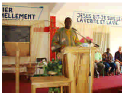
En söndag i Mbour, Senegal