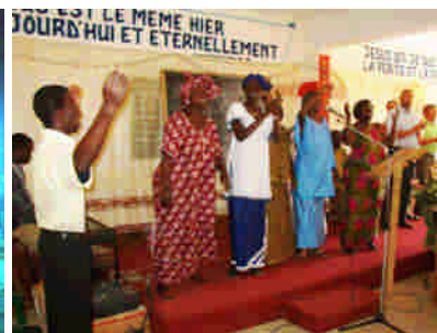
Förmiddagsmöte i Mbour