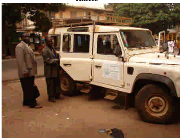
Med Dabolaprojektens Landrover i Kindia. Landrovern tillhör numera AD i Guinea.