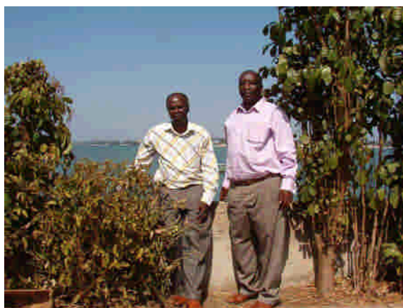
Conakry, huvudstaden i Guinea, från Hôtel Petit Bateau.