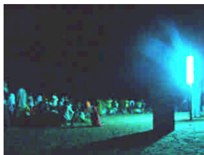
Väckelsemöte i staden Ndiaganiao