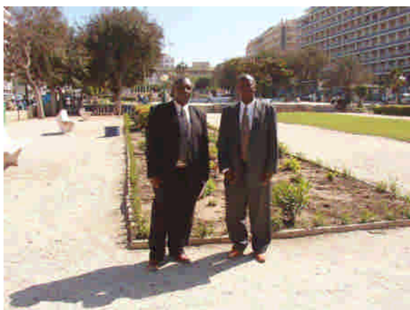
Dakar huvudstad i Senegal, Place d'indépendance.