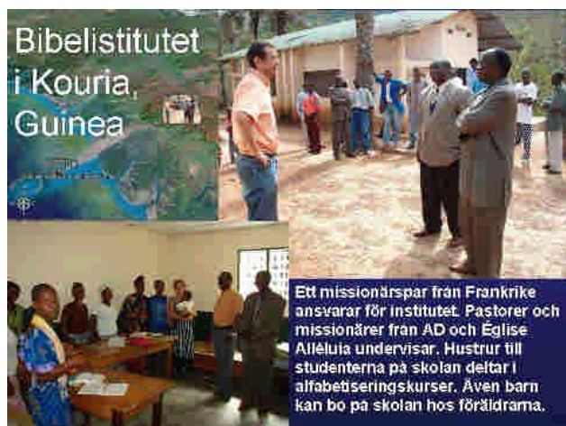
En missionärspår från Frankrike ansvarar för institutet. Pastorer och missionärer från AD och Église Alléluia undervisar. Hustrur till studenterna på skolan deltar i alfabetiseringskurser. Även barn kan bo på skolan hos föräldrarna.