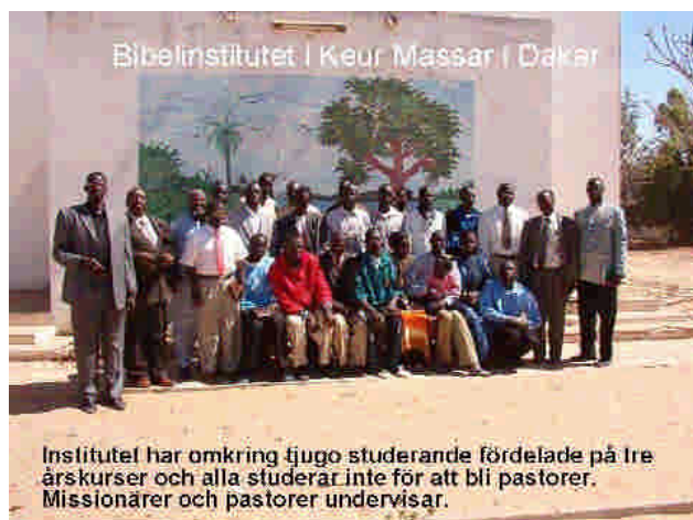
Institutet har omkring tjugo studerande fördelade på tre årskurser och alla studerar inte för att bli pastorer. Missionärer och pastorer undervisar.

Undervisningen ges med hjälp av pastorer och missionärer i båda bibelinstituten.