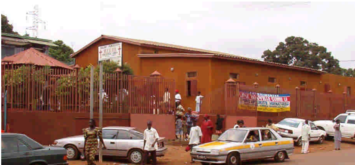
Église Alléluia i Belle-Vue i Conakry