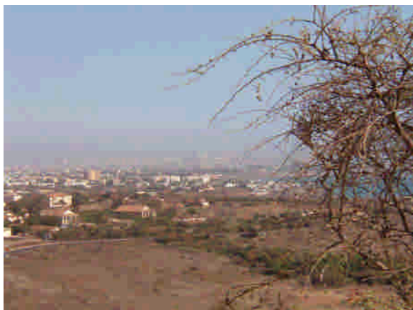
Storstaden Dakar från "Les Mamelles"

till för problemfria transporter till och från centrum. Avgaserna från tomgående bilar och dieselmotorer som spyr ut kolsvart rök blandas med det damm som finns under de långa torrperioderna. När jag var i Conakry i början av min resa i februari kom ett oväntat regn en natt och det var uppfriskande. I Conakry regnar det annars stora mängder under regnperioden.