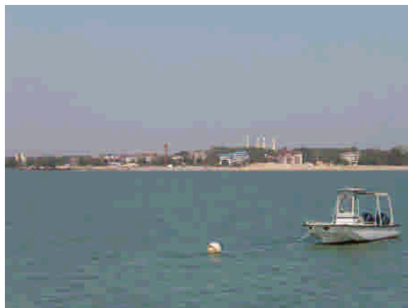
Storstaden Conakry från Hôtel Petit Bateau.