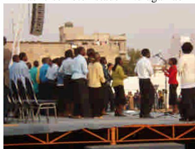
Evangelisationskampanj den 22 – 24 mars på Terrain de Khar Yalla i Dakar (Kampanjen pågick sedan till den 26 mars)